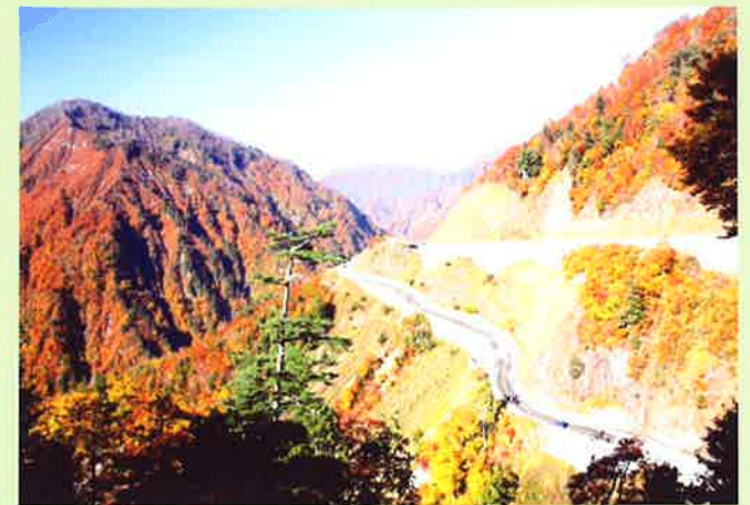
紅葉的第二字形急轉彎