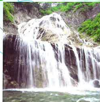
1991年被選為“日本瀑布100選”